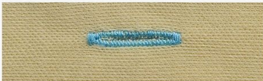
Knitting button hole with basting stitch