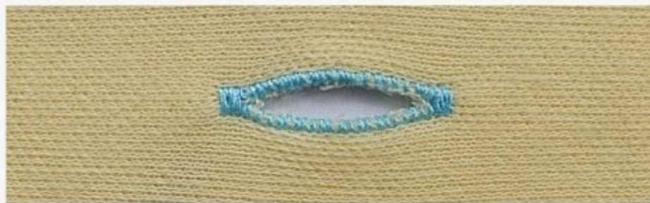
Knitting button hole without basting stitch

Использование этой функции для прорези большого пуговичного отверстия без смен ножа.